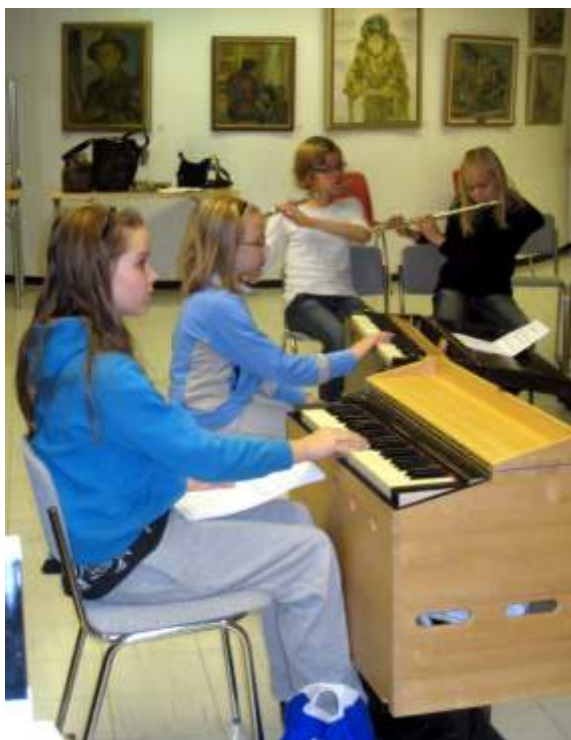
Tämmösoasto säestää huilisteja.

Soittaminen aloitettiin kansanmuusikoiden tapaan korvakuulolta opettelemalla, aloittaen melodian laulamisesta. Ryhmässä suoritettiin työnjako melodian soittajiin ja säestäjiin, ja korvakuulolta etsityt säestyssoinnut rytmitettiin kappaleeseen sopiviksi.